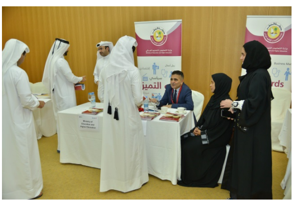
Ministry of Education and Higher Education presenting their scholarship rules and offering assistance to interested students