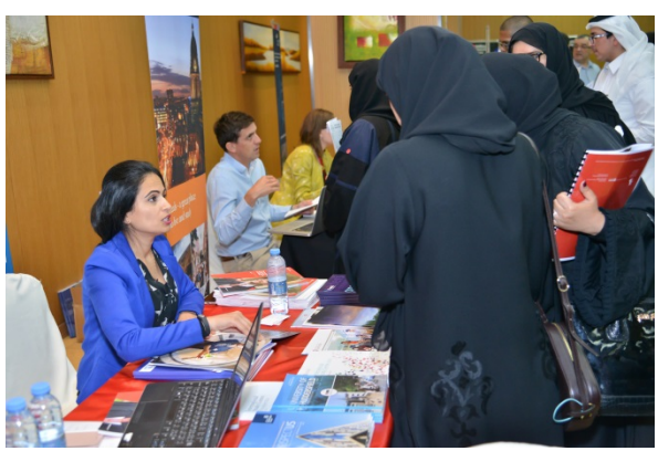
Exhibiting UK institutions meeting potential students and offering on-spot admission letters