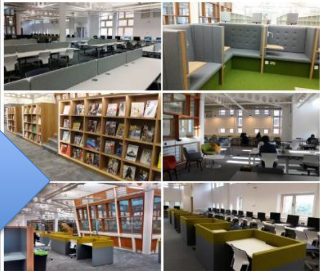
리모델링 이후 새로워진 Lanchester 도서관 모습