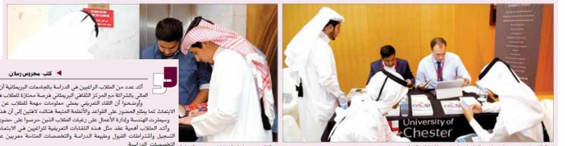
الطلاب يتعرفون من مشوب إحدى الجامعات على فرص والفرص للقبول

دراسة إدارة الأعمال والهندسة بجامعة بريطانية تصدران رغبات طلابنا