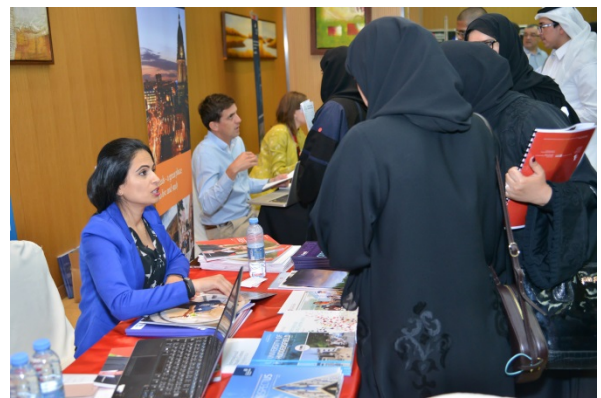
Exhibiting UK institutions meeting potential students and offering on-spot admission letters