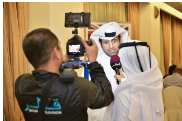
Media coverage by Qatar TV, Al Rayyan TV and local newspapers