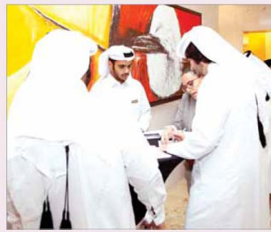
الطلاب يتعرفون على إجراءات القبول