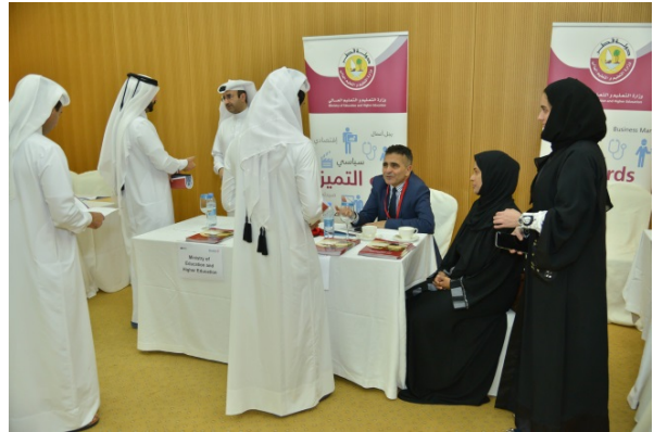
Ministry of Education and Higher Education presenting their scholarship rules and offering assistance to interested students