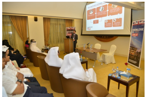
Visa Application Presentation by UKVI representative from the British Embassy