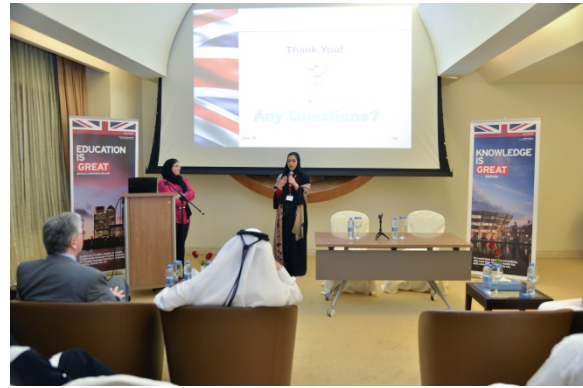
UK Alumni from Qatar sharing their experience with prospective students