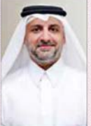
د. خالد الحر

أكد الدكتور خالد الحر مدير هيئة التعليم العالي وزارة التعليم والتعليم العالي وجود أكثر من 800 جامعة مرشحة في قوائم الابتعاث، وذلك بناءً على معايير محددة. وتعد هذه القائمة من أهم قوائم الجامعات المرشحة للابتعاث، حيث تضم 800 جامعة مرشحة في قوائم الابتعاث، وذلك بناءً على معايير محددة.