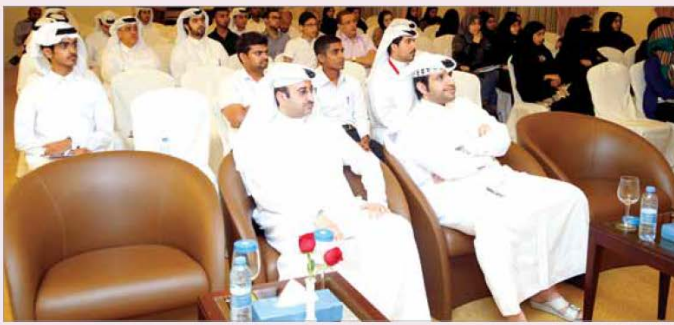
جانبا من الحضور